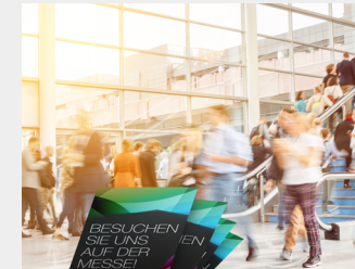
... als Streuartikel