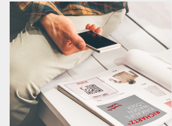
... als Kollektionsartikel