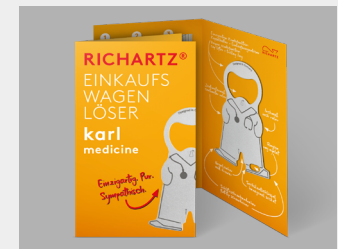
... mit Standardverpackung